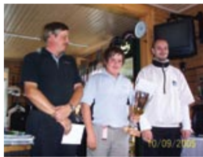
YkkösGolf 2005 palkinnot on jaettu ja mestarit selvillä.

Asiantilan korjaamiseksi helpoin tapa olisi luonnollisesti se, että kaikki aikuisjäsenemme, lähi- ja kaukomailla, hankkisivat oman osakkeen. Tällöin kenttämme olisi mahdollista laajentua täysimittaiseksi 18 reikäiseksi kentäksi. Tämän riemun lisäksi jokainen osakasjäsenemme saisi myös parhaat edut (alennuksia) ja kohtelun Suomen golfkentillä pelatessaan. On nimittäin nähtävissä, että pelaamiskäytännöt lähes kaikilla Suomen kentillä tiukkenevat ja hinnat nousevat henkilöillä, jotka eivät ole osakkaana jollain Suomen golfyhtiöistä. Näillä leveysasteilla mukavan ja hyödyllisen harrastuksen piiriin pääsee lisäksi edullisin kustannuksin. Osakkeen omistajilla koko kauden pelikustannukset ovat nimittäin edullisemmat kuin päivittäisen Iltasanomien ostoon kulutettu vuotuinen maksu! Faktaa tämäkin, juoruja ja skandaaleja lukiessa ei kasva kunto vaan mielipaha! Valintakysymyk-