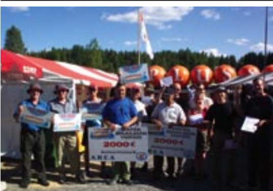
Isot potit olivat kyseessä, kun heinäkuun alussa kisailtiin Kuortaneen soutukarnevaalien merkeissä lajissa jos toisessakin. Vesillä tietenkin. Moni golfari hieraisi tapahtuman aikana silmiään, olenko tullut golfklubille vai markkinoille? Yleensä golfkentät ja klubit sijaitsevat alueilla jossa ei törmää muihin kuin pelikaverihin. Näin ei ole Kuortaneella, vaan onneksemme saamme silloin tällöin nauttia mitä erilaisimmista tapahtumista ja vipinöistä. Jopa golfklubin alueella. Ensi vuonna karnevaalit järjestetään 1-2.7. Laita aika allakkaasi ja saavu tunnelmaan. Lisätiedot www.soutukarnevaalit.fi sivuilta.

Sopinee lainata, vuosia sitten eräessä lehdessä olleen matkakertomuksen loppukaneettia, joka voisi kuvastaa osallistuneiden senioreiden tunteja kotiovella jäätessä; "Kaihon kyynel kimmelsi lähes jokaisen kulmilla."