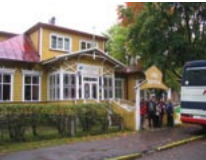
Ollaan lähdössä kotimatalle ryhmän toisesta majapaikasta, Villa Katariinasta.

Lisäksi kenttäalueelta löytyy tusinan verran vesiesteitä. Väylien muotoiluun on käytetty runsaasti esteitä nostettuja maamassoja. Kentän yleisilme on kumpuileva dynimaisema. Tasaista on ja pitkiä kapeita väyliä, siinä riittää haastetta, onhan par-arvokin 72.